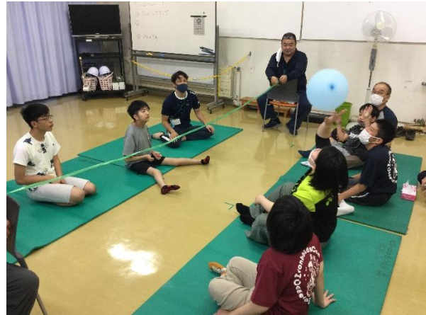
シッティング風船バレー