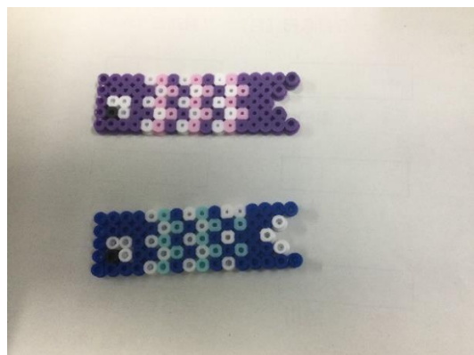
かわいい鯉のぼりができました