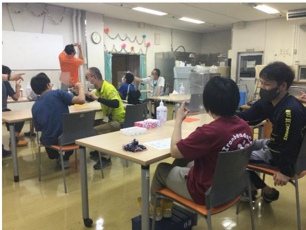
指文字・手話を体験しました。