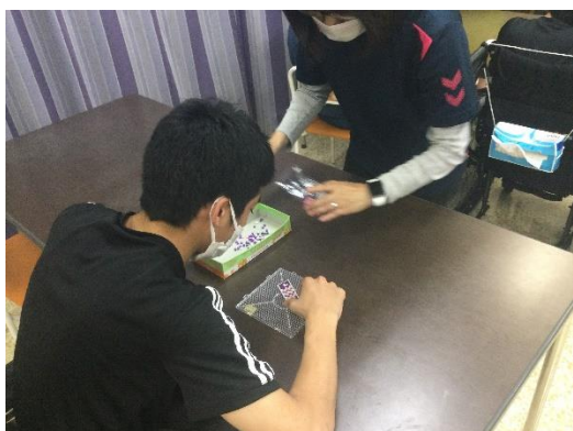
アイロンビーズで鯉のぼりづくり