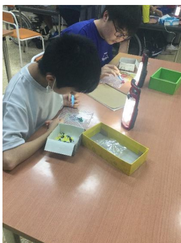
アイロンビーズでキャラクターづくり